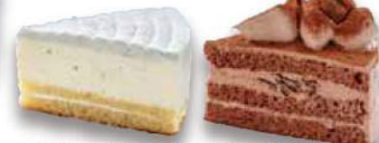
レアチーズケーキ